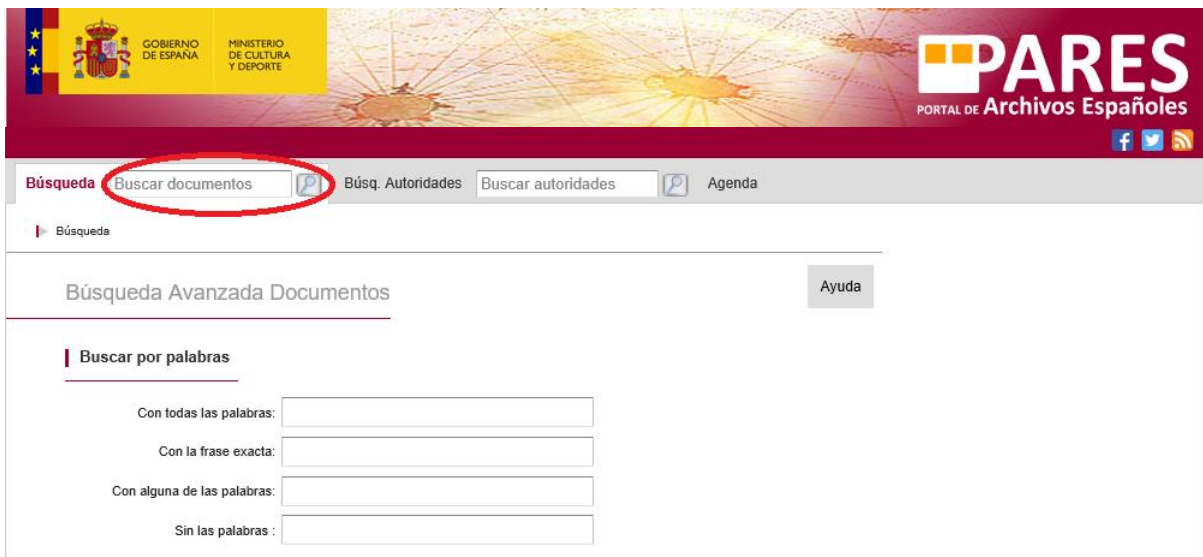
Ejemplo de búsqueda de documentos

Desde cualquier pantalla del Portal PARES: